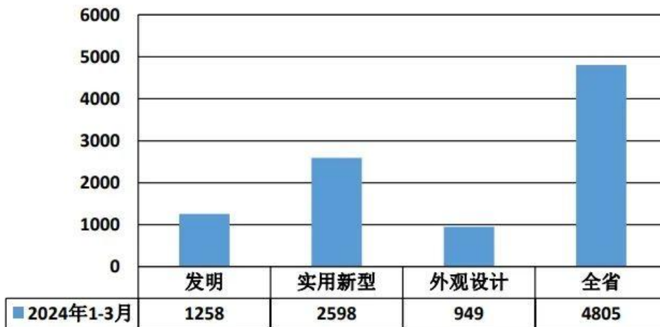
2024年1-3月贵州省三种专利授权情况（单位：件）

2024年一季度，全省授权专利4805件，PCT申请受理专利160件。其中，发明专利1258件，实用新型专利2598件，外观设计专利949件。