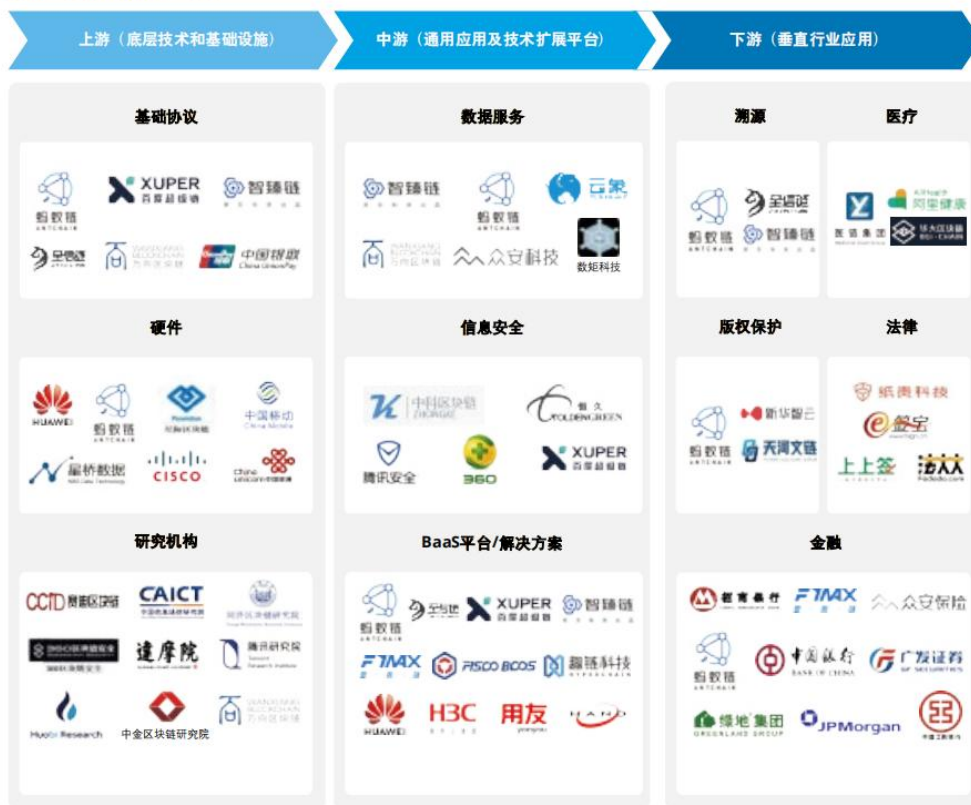
图36：国内区块链产业图谱

中国，大陆地区严格禁止加密货币的发行、交易等金融行为，中国香港地区开始尝试数字资产交易、数码港元的政策制定和试点，将可能成为链接中国与全球市场的纽带；